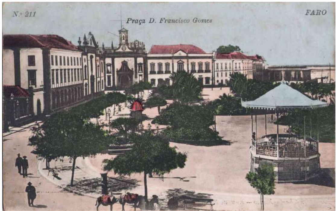
Imagem 2: Postal ilustrado da Praça D. Francisco Gomes, zona nobre da cidade de Faro.

Disponível em Arquivo Digital de Postais Ilustrados: